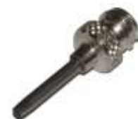
Extraktionsnadel ID: 1,9 mm