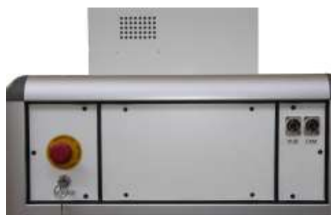
Seitenansicht (oben rechts)

Der Spot Hunter wurde ausführlich mit High-End Elektrophorese plastic-backed Fertiggelen des Herstellers Gel Company, gefärbt mit LavaPurple™ und SYPRO®Ruby, getestet.